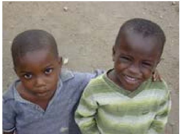
Campo rifugiati in Ghana