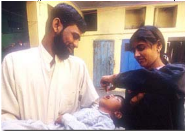
Programma Polio Plus