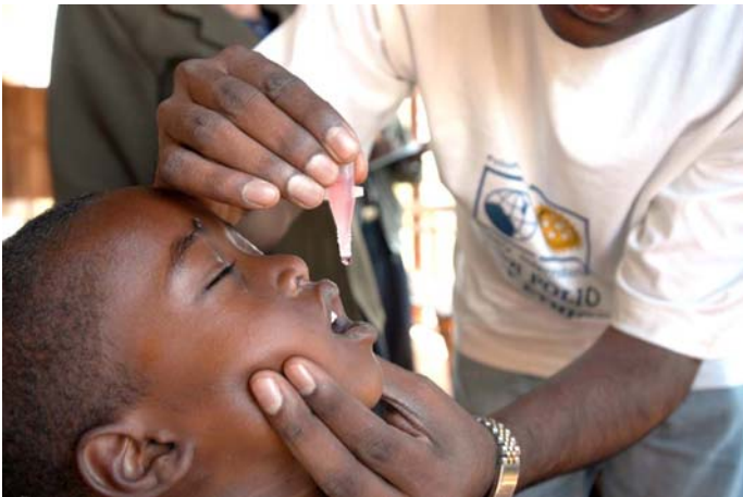
Rotary Immunization Program